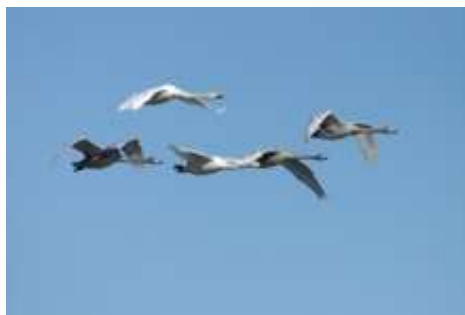
オオハクチョウ（飛行中）

オオハクチョウの飛来数がピークになります。多い年には風蓮湖と温根沼合わせて5000羽以上にもなることがあります。カモのオスは非繁殖期の地味なエクリップスから美しい繁殖羽へと姿を変えていきます。草原や湿原などにケアシノスリやハイイロチュウヒといった猛禽類が渡って来始めます。春国岱のオホーツク海側では、クロガモなどの海ガモ類が多数見られるようになります。