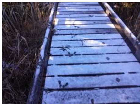
木道に残る動物の足跡