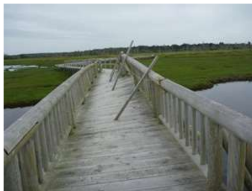
修繕前の木橋の様子

木橋及び木道工事...11月1日～11月12日 ご理解とご協力をお願いいたします。