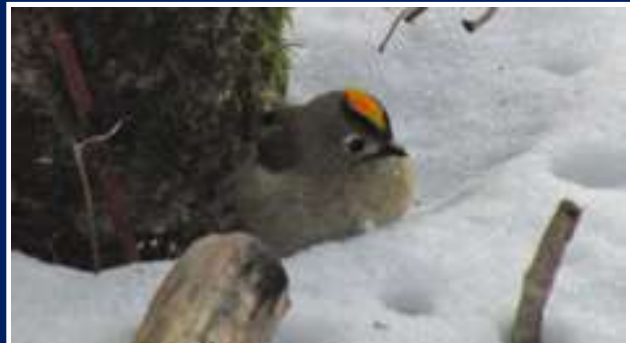
英名 Goldcrest 学名 Regulus regulus