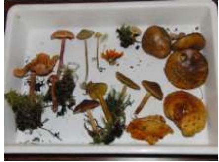
春国岱でみられるキノコ

このようにキノコは、私たちにそこで起こった、または、起こっている出来事を教えてくれます。キノコを見つけたら、そのキノコの特徴をヒントに「そこで何が起きたか」、推理を楽しんでみてください。