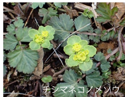
チシマネコノメソウ

植物の花粉は、虫や風、鳥など、いろいろなものに運ばれます。ネコノメソウの仲間は、なんと花粉がカタツムリに運ばれる、カタツムリ媒花と言われているのですが、その根拠となる論文が見つかりませんでした。カタツムリが花の上を這うことで体についた花粉が運ばれるのだと思いますが、カタツムリは花に何をしに来るのでしょうか？葉を食べに来るのでしょうか？