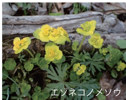
エゾネコノメソウ

ネコノメソウという花を知っていますか？ 春国岱ネイチャーセンター横の小鳥の小道では、黄色い花と葉が目立つ「エゾネコノメソウ」と、全体的に緑色の「チシマネコノメソウ」という2種類のネコノメソウを見ることができます。