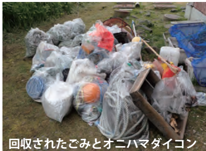
回収されたごみとオニハマダイコン