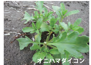
オニハマダイコン