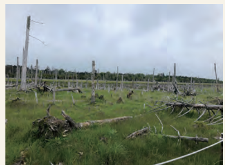
立ち枯れたトドマツ