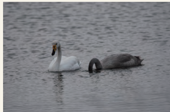
※写真は2021年11月4日に春国岱湾で観察されたオオハクチョウの家族