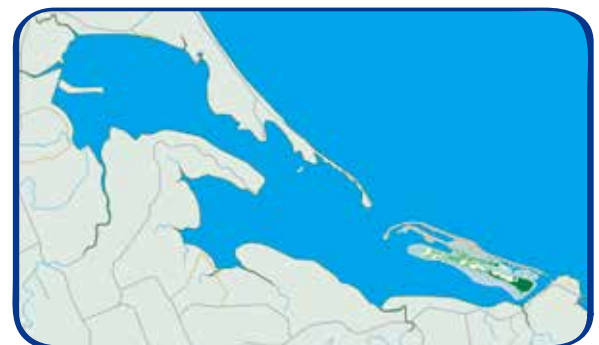
ラムサール条約湿地